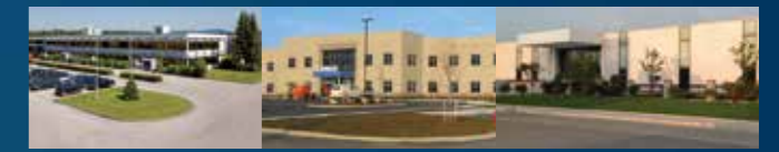
● Bihler Füssen ● Bihler of America Inc. Phillipsburg, NJ ● Bihler Machinery Kunshan

Kundennähe, direkter Kontakt und ständige Kommunikation haben oberste Priorität bei Bihler. Wir stehen Ihnen jederzeit mit schnellem Support zur Verfügung - an jedem Ort dieser Erde. Dafür sorgt unser weltweites Service- und Vertriebsnetz mit Niederlassungen in den USA und China sowie Handelsvertretungen in den wichtigsten Industrienationen. Zentrale Schnittstelle aller Aktivitäten ist der Bihler-Stammsitz in Halblech.